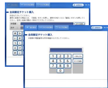
⑫お客様の氏名・電話番号を入力