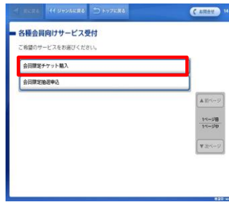
⑦「会員限定チケット購入」を選択