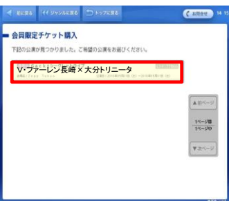
⑨ご希望の試合を選択