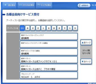
⑤「V・ファーレン長崎」 …ファンクラブ会員割引販売 …後援会(個人)割引販売 …後援会(団体)割引販売 のいずれかを選択