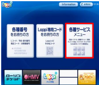
①「トップ画面」 ⇒「各種サービスメニュー」を選択