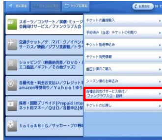
③「各種会員向けサービス受付/…」を選択