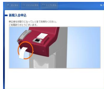
⑭申込券をお取りになり、 レジにて代金お支払いの上、 チケットをお受取りください