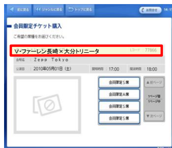
⑩ご希望の「席種」「券種」「枚数」を選択