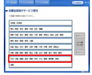
⑧「九州・沖縄」を選択