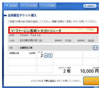
⑪内容をご確認の上、「申し込む」をタッチ