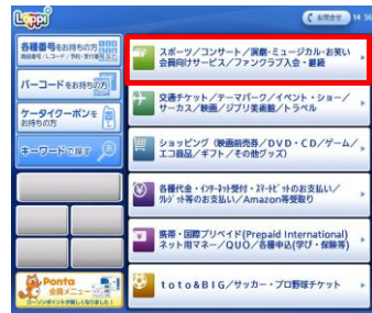
②「スポーツ/コンサート/…」を選択